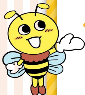
川崎医療生協 公式マスコット はっちくん